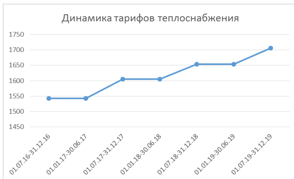
Рисунок 4 - Динамика утвержденных тарифов МУП «Чистопольский комхоз» на тепловую энергию за 2015-2019 гг.

Плата за услуги по поддержанию резервной тепловой мощности, в том числе для социально значимых категорий потребителей в МУП «Чистопольский комхоз» не утверждена.