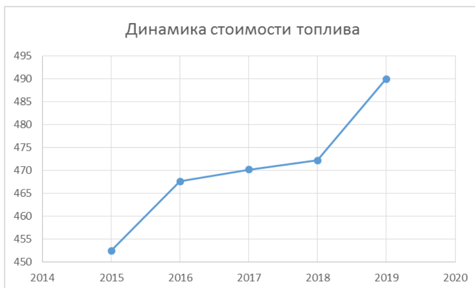
Рисунок 2 - Динамика стоимости используемого топлива, тыс. руб.