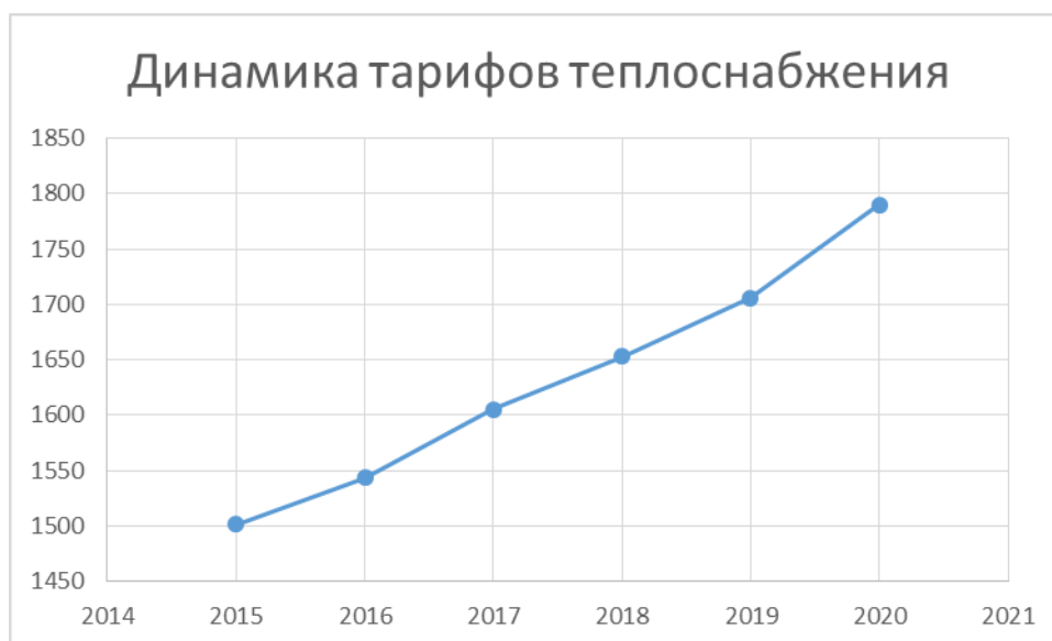
Рисунок 4 - Динамика утвержденных тарифов МУП «Чистопольский комхоз» на тепловую энергию за 2015-2020 гг.

Плата за услуги по поддержанию резервной тепловой мощности, в том числе для социально значимых категорий потребителей в МУП «Чистопольский комхоз» не утверждена.