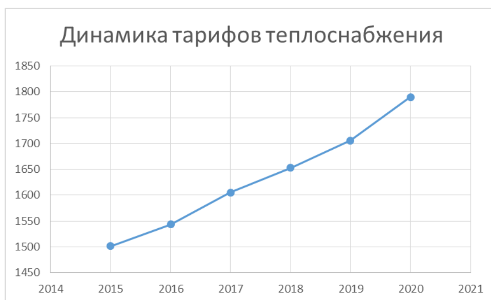
Рисунок 1 - Динамика утвержденных тарифов МУП «Чистопольский комхоз» на тепловую энергию за 2015-2020 гг.

Плата за услуги по поддержанию резервной тепловой мощности, в том числе для социально значимых категорий потребителей в МУП «Чистопольский комхоз» не утверждена.