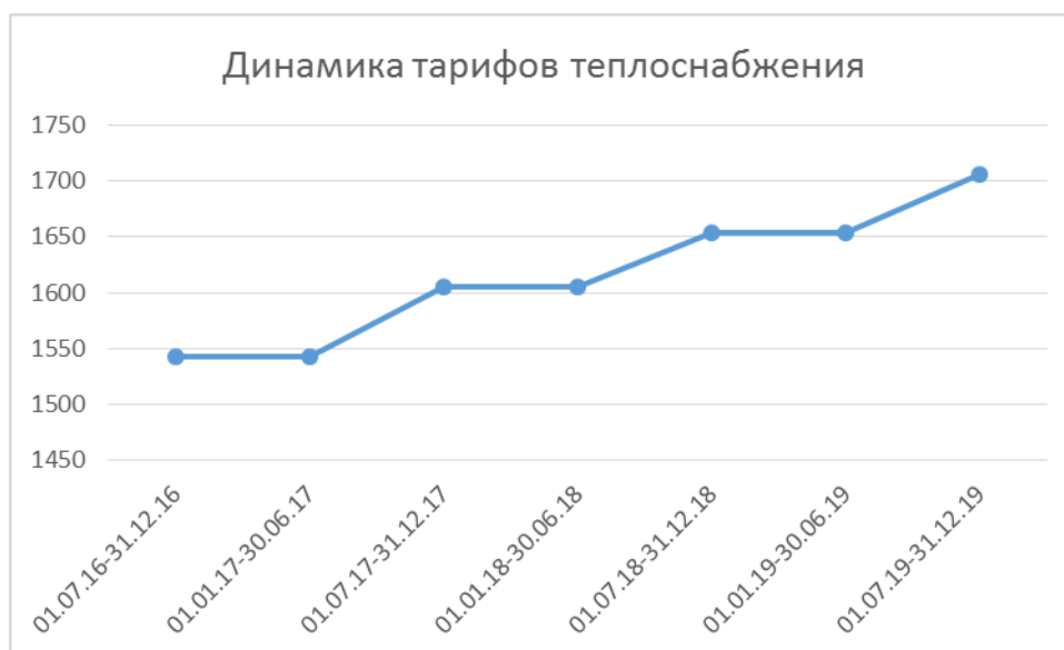
Рисунок 1 - Динамика утвержденных тарифов МУП «Чистопольский комхоз» на тепловую энергию за 2015-2019 гг.

Плата за услуги по поддержанию резервной тепловой мощности, в том числе для социально значимых категорий потребителей в МУП «Чистопольский комхоз» не утверждена.