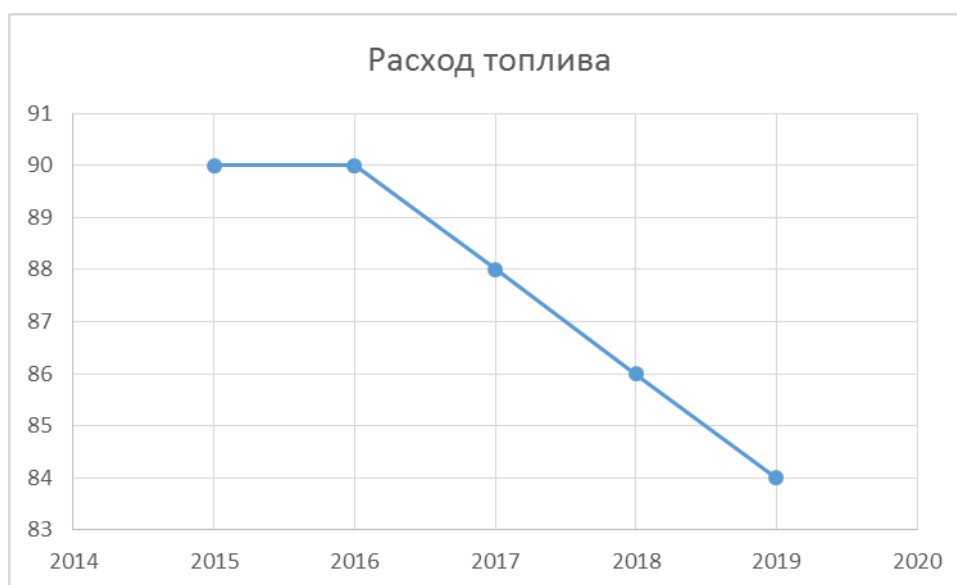
Рисунок 3 - Годовой расход газа на выработку тепловой энергии, , тыс. м 3